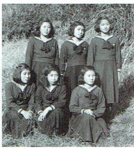
第三高女5年生の時、同級の友人たち (前列中央)

お手々つないで廊下を歩くのも厳禁でした。手をつないだり肩を組んだり、小学生まで。それでも、仲良し同士、ついで、手をつないでいると、袴の裾を蹴立てて走ってこられたお作法の先生に、手の間をばしと叩かれました。廊下を走るのには禁じられていますが、お作法の先生が生徒を咎めるために走られるのは、OKなものでした。庇髪に和服の痩せて小柄な老先生は、おそらく、生徒に最も怖がられていたと思います。