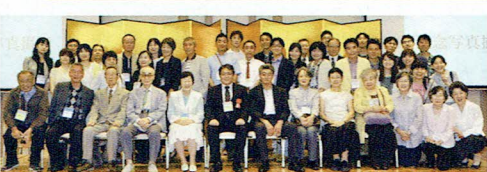
▶世代を越えて集合