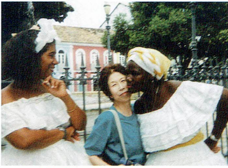
1998年サルバドールにて