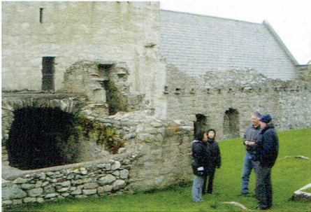
2010年グラニューエル城の外観