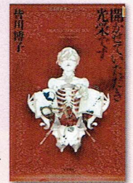
本格ミステリ大賞受賞の著書▶ 「開かせていただき光栄です」

は、そらぞらしいです。それで も、敗戦の悲惨などん底から見 事に立ち直った日本への信頼だ けは、ゆるぎませんが。