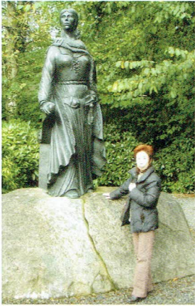
1998年リオ・デ・ジャネイロ コルコバードの丘 2010年アイルランドの海賊女王 グランド・オマリイの像