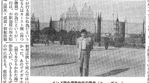
インド国会議事堂前の筆者(ニューデリー)