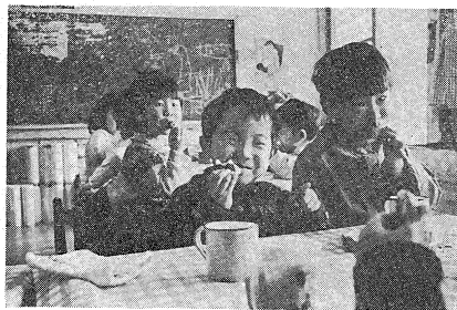
幼稚園のこのころ