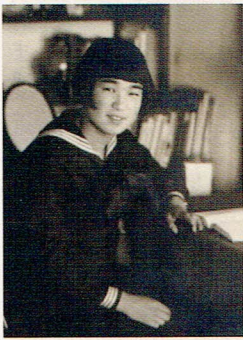
第三時代 自宅の勉強部屋で

一九六四年、母校ドレスメーカーの主催で一機チャーターしてパリに向つた。折しも前回の東京オリンピックの年であつた。「東京へ是非来て下さい。」とすすめてもパリジャンは皆「ノン」と首を振るだけであつた。東京の知名度は低かつたのである。帰国後、サロンデモードといふ服飾団体の役員として、銀座の日生会館11階のパンケットホールでファッションショーを開き作品を発表した。退職後、放送大学の開校に伴い、「人間の探求」と「社会と経済」を二回卒業した。