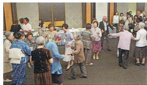
コチロンダンス披露