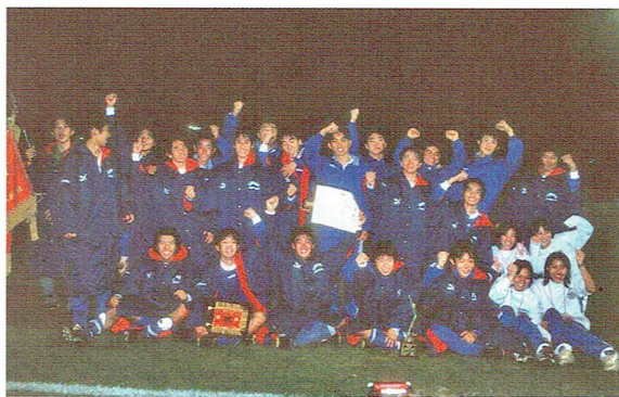
高校サッカー選手権出場を決めた試合