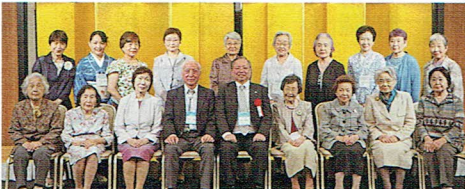
コチロンメンバー